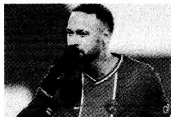
NEYMAR comemora gol do PSG contra o Montpellier

Com o triunfo, o líder PSG foi a 45 pontos, abrindo três em relação ao vice-líder Lille, que ainda joga nesta rodada, no domingo, às 13h (de Brasília), diante do Rennes, fora de casa. Já o Montpellier está em 11ª, com 28.