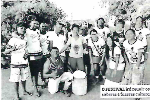
O FESTIVAL irá reunir os saberes e fazeres culturais

O I Festival de Batuques de Quilombos do Piauí será realizado nos dias 11 e 12 de novembro, na Comunidade Quilombola Salinas, em Campina do Piauí. A programação do evento, que tem como tema: "Batuques: Vozes Ancestrais", conta com oficinas de canto, dança e percussão, além de rodas de diálogos entre os grupos participantes para troca de saberes e fazeres culturais vividos pelos batuqueiros em cada comunidade.