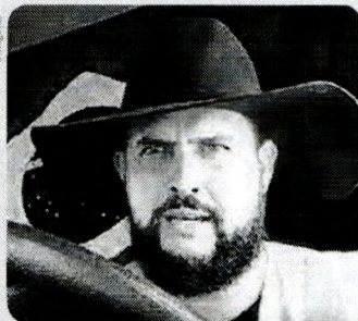
IMAGEM QUE PALAVRA