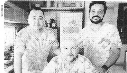
O PAI ESTAVA FORAGIDO ATÉ O FECHAMENTO DESSA MATÉRIA