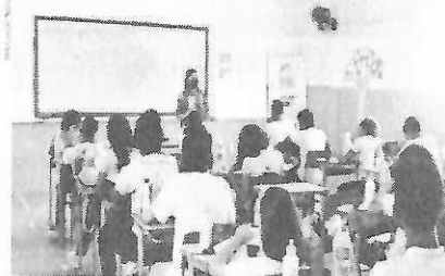
MATRÍCULAS iniciaram nesta terça-feira (30), e seguem até o dia 30 de dezembro

Já a confirmação presencial deve ser feita na Unidade Escolar ou Centro de Ensino escolhido pelo estudante quanto a matrícula on-line e ocorrerá por meio de registro em livro de matrícula, ficha individual e com a entrega da documentação exigida no Edital. Esta etapa será no período de 03 a 07 de janeiro de 2022, conforme agendamento da escola em atendimento ao Protocolo