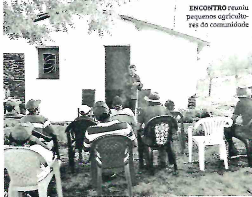
ENCONTRO reuniu pequenos agricultores da comunidade

A ação tem como principal objetivo a criação de uma comunidade na localidade, fortalecendo a mesma em tomadas de decisões e desenvolvendo entre os moradores o senso de união e de trabalho em conjunto para um melhor desenvolvimento rural na comunidade.