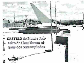
CASTELO do Piauí e Juazeiro do Piauí foram alguns dos contemplados

No município de Juazeiro do Piauí também foram entregues obras de calçamento com extensão de 17 mil metros quadrados, orçadas em 1,5 milhão de reais. A chefe de executivo visitou ainda o município de São Miguel do Tapuío e o Quilombo dos Macacos, onde participou de solenidade e recebeu demandas da população daquela comunidade.